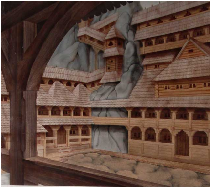
Виглядний двір дотераз http://www.skole.com.ua/